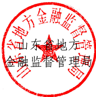
山东省地方金融监督管理局