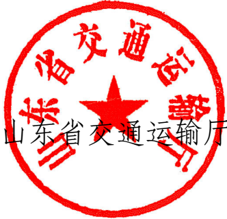
山东省交通运输厅