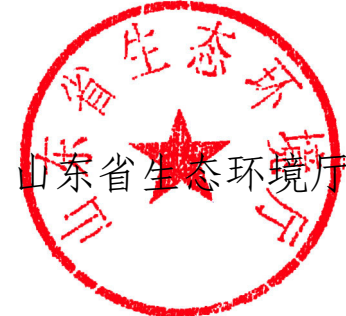
山东省生态环境厅