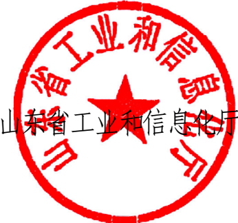
山东省工业和信息化厅