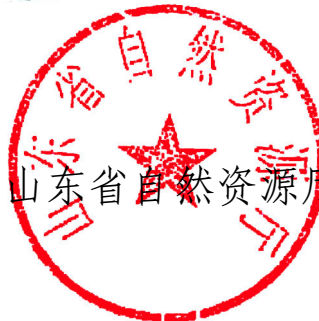
山东省自然资源厅