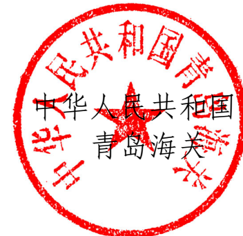
中华人民共和国青岛海关