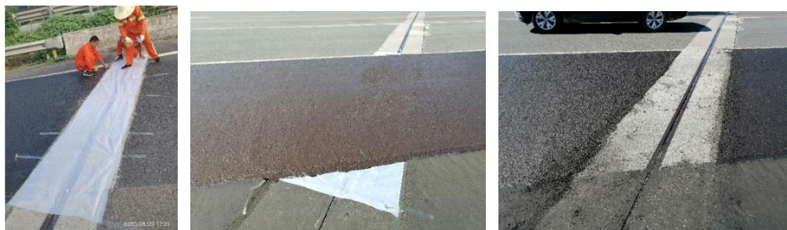
图 A.2 桥涵伸缩缝处横向接缝施工

A.1.3 桥涵伸缩缝处横向接缝施工要点：将桥涵伸缩缝包裹厚塑料布（或土工布），摊铺后及时移除塑料布（或土工布）及其上的稀浆混合料，用铁锹及时修整高黏微表处与伸缩缝连接断面，使之与伸缩缝连接平顺（图 A.2）。