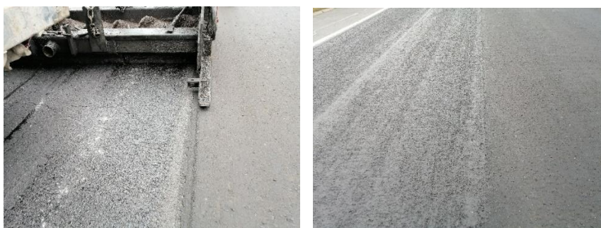
图 A. 3 纵向搭接接缝